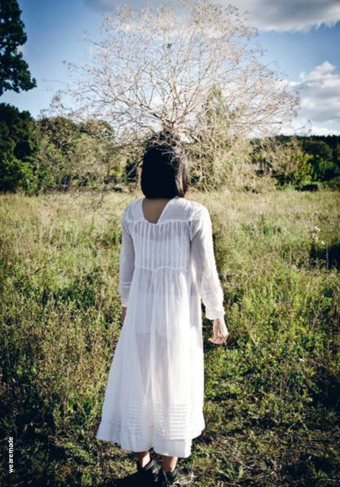
we are made

künstlerische leitung/choreographie: toula limnaios / film/kamera/schnitt: giacomo corvaia / komposition/musik: ralf r. ollertz / paul tinsley / tanz/kreation: daniel afonso / leonardo d'aquino / daeho lee / katja scholz / hironori sugata / karolina wyrwal / inhee yu / assistenz: ute pliestermann / kostüme: antonia limnaios / toula limnaios 39