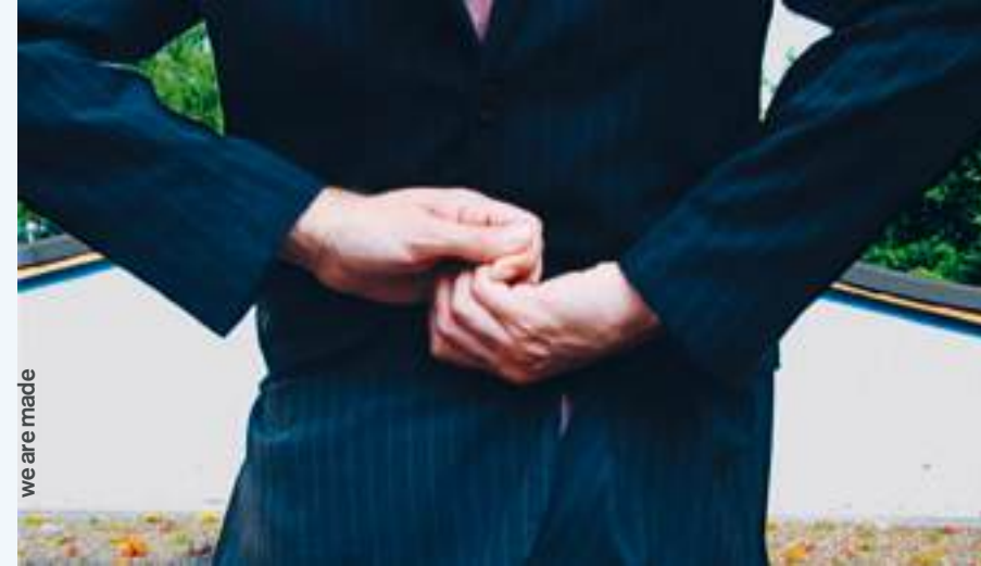
we are made

im festival verwandelt sich das foyer der HALLE an ausgewählten abenden in ein kino, in dem wir tanzfilme sowie dokumentationen über die compagnie zeigen. during the festival, the foyer of HALLE will transform on selected evenings into a cinema, where we will present dance films as well as documentaries about the company.